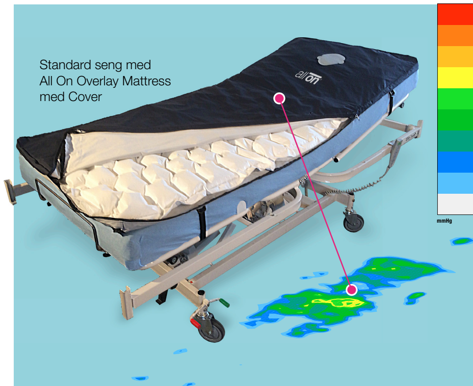
Standard seng med All On Overlay Mattress med Cover