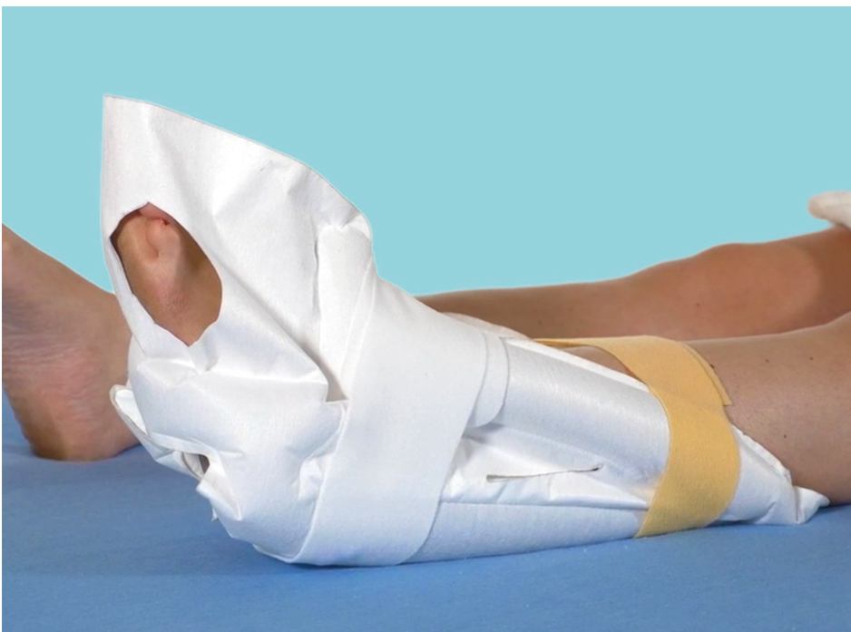
Heel up Produktdatablade 2026 v1 (CUT-Medium DE)